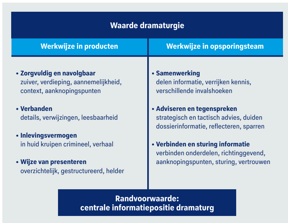
Figuur 7: waarde dramaturgie