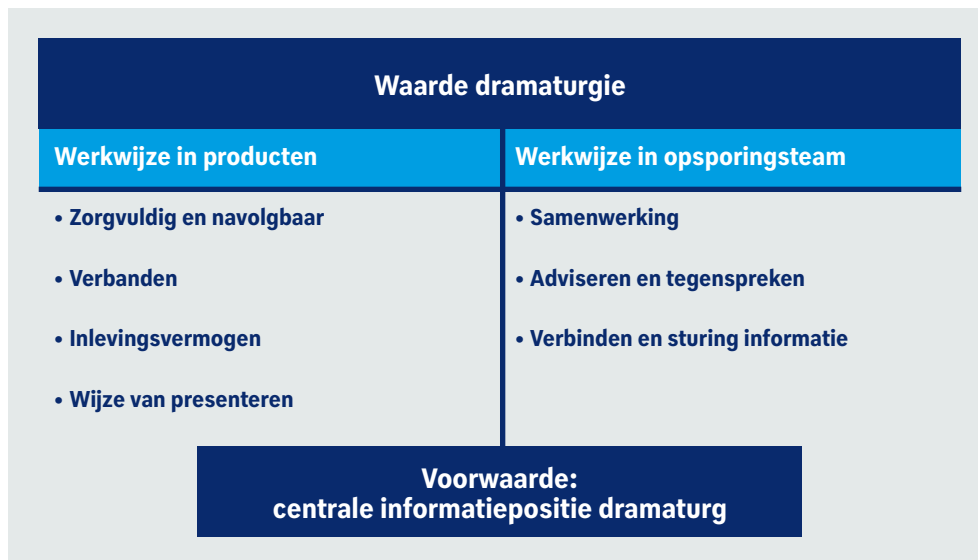
Figuur 16: waarde dramaturgie

In figuur 16 staan de resultaten van de aan de dramaturgie toegekende waarden voor de opsporing. Om deze waarden te realiseren, is het cruciaal dat een opsporingsdramaturg een centrale informatiepositie kan en mag innemen in het opsporingsonderzoek.