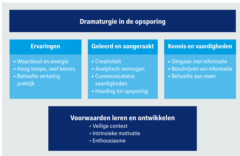
Figuur 10: ervaringen, geleerde kennis en vaardigheden masterclasses opsporingsdramaturgie

De reacties van deelnemers en docenten bevestigen dat er in het brein van de deelnemers bestaande ‘paadjes’ zijn verrijkt en nieuwe ‘paadjes’ aangelegd waarover informatie en kennis verplaatst kan worden. Tegelijkertijd blijkt dat vijf dagen opsporingsdramaturgie (te) kort voelde voor deelnemers om het geleerde in de praktijk te kunnen brengen.